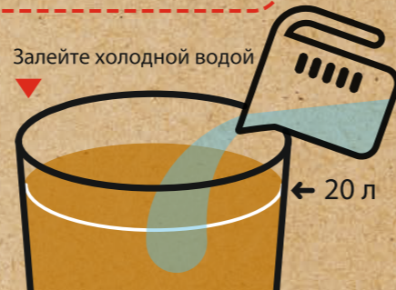
Залейте холодной водой

д Долейте в ферментер холодной воды до 20 л. С помощью чистого контейнера возьмите 100-150 мл образца и снимите показатели плотности.